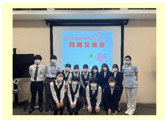
＼2023年4月入職事務職員／